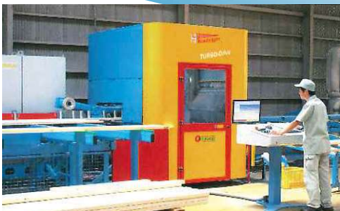
マルチカットソー